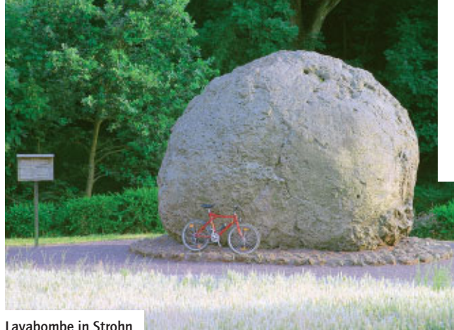
Lavabombe in Strohn

Schleifen: Acht Schleifen im Bereich der Vulkaneifel Die Schleifen rund um Daun: S1 Schleife Mehren, Länge 3 km S2 Schleife Brockscheid-Holzmaar, Länge 6,5 km S2.1 Schleife Vulcano Infoplattform Steineberg-Gillenfeld, Länge 16 km S2.2 Schleife Mürmes-Saxler-Ellscheid, Länge 10 km S3 Schleife Strohn-Mückeln, Länge 12 km Die Schleifen rund um Manderscheid: S4 Erlebnisschleife Kloster-Buchholz, Länge 9 km S5 Erlebnisschleife Grafschaft, Länge 6 km S5.1 Erlebnisschleife Greimerath, Länge 3 km