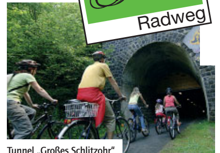
Tunnel „Großes Schlitzohr“

Interessantes zum Kinderradweg gibt es unter www.kinderradweg.de und im Magazin auf Seite 46.